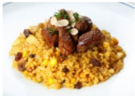
フィレビーフドライカレー 1,749円