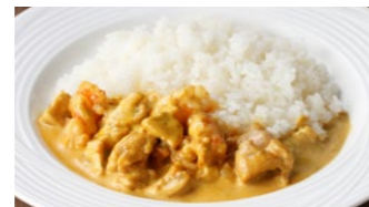
クリームカレー 1,749円