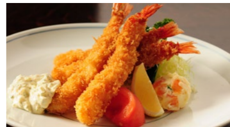
海老フライ タルタルソース 1,749円