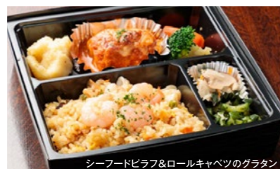
シーフードピラフ&ロールキャベツのグラタン