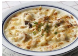
チキンと木の子 のマカロニグラタン/ドリア 1,730円