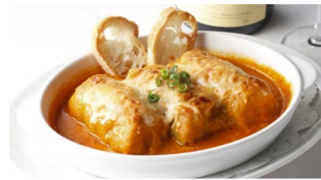
ロールキャベツ満天星風(トマトソース) 1,730円