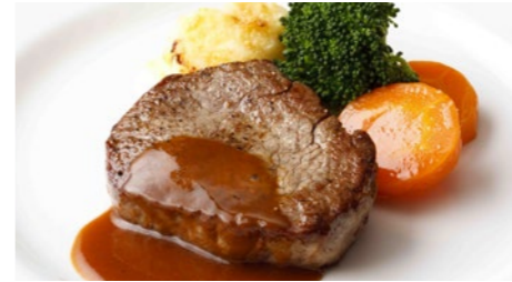
牛フィレステーキ(和風 または デミグラス) 3,780円