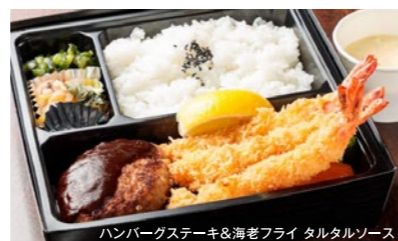
ハンバーグステーキ&海老フライ タルタルソース