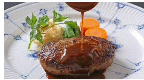
ハンバーグステーキ デミグラス 1,730円