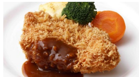
宮崎産南の島豚カツカツ(ロース) 2,160円