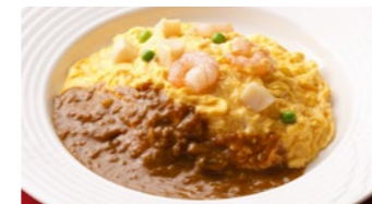
オムレツライスカレー 1,730円 (5~9月は衛生の観点より提供中止とさせていただきます)