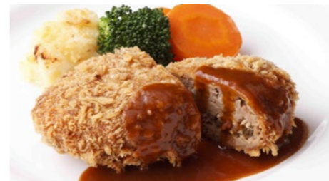
メンチカツ デミグラス 1,730円