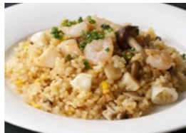
海の幸のピラフ 1,730円