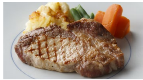
宮崎産南の島豚ロース(ソテー) 2,160円 (デミグラス または ジンジャーソース)