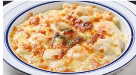
海の幸のマカロニグラタン/ドリア 1,730円