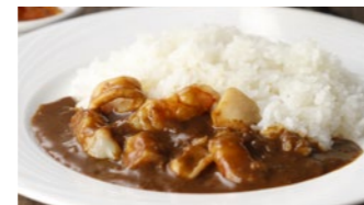
シーフードカレー 1,730円