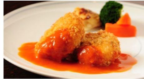
蟹クリームコロッケ (ライス または パン付) 1,730円