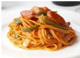
スパゲティ ナポリタン 1,620円