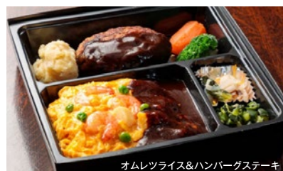
オムレツライス&ハンバーグステーキ