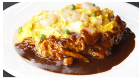
オムレツライス デミグラス 1,730円 (5~9月は衛生の観点より提供中止とさせていただきます)