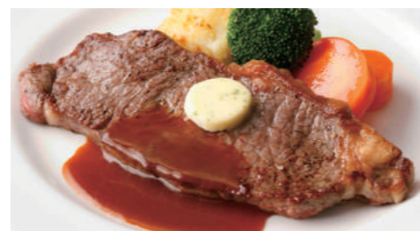
牛サーロインステーキ(和風 または デミグラス) 3,670円