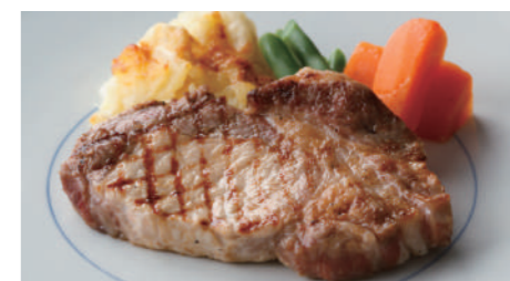
宮崎産南の島豚ロース(ソテー) 2,160円 (デミグラス または ジンジャーソース)