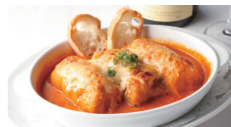
ロールキャベツ満天星風(トマトソース) 1,840円