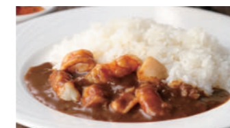
シーフードカレー 1,750円