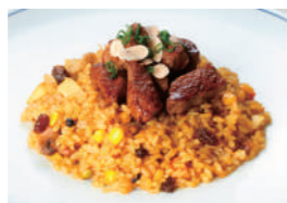
フィレビーフドライカレー 1,940円