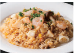
海の幸のピラフ 1,750円