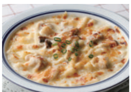
チキンと木の子のマカロニグラタン/ドリア 1,750円