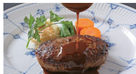
ハンバーグステーキ デミグラス 1,840円