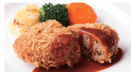
メンチカツ デミグラス 1,840円