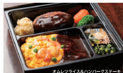
オムレツライス&ハンバーグステーキ