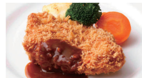
宮崎産南の島豚カツカツ(ロース) 2,160円