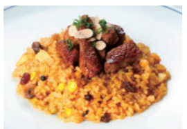
フィレビーフドライカレー 2,040円