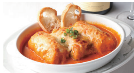
ロールキャベツ満天星風(トマトソース) 1,840円