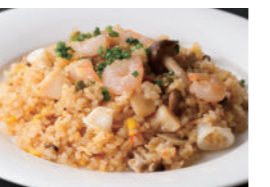
海の幸のピラフ 1,840円