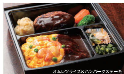
オムレツライス&ハンバーグステーキ