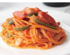
スパゲティ ナポリタン 1,750円