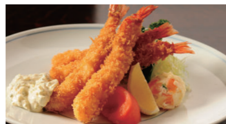
海老フライ タルタルソース 1,940円