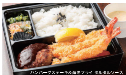
ハンバーグステーキ&海老フライ タルタルソース