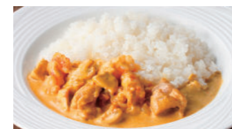
クリームカレー 2,040円