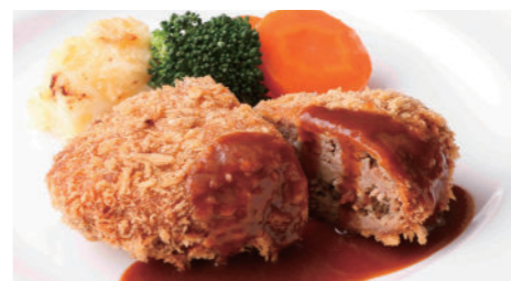
メンチカツ デミグラス 1,940円