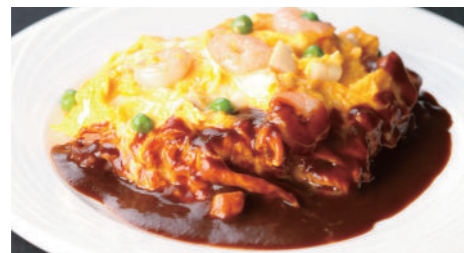
オムレツライス デミグラス 1,840円 (5~9月は衛生の観点より提供中止とさせていただきます。)