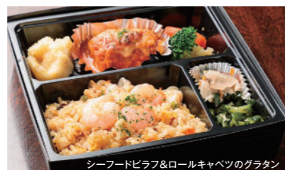
シーフードピラフ&ロールキャベツのグラタン