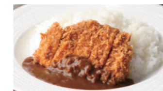
ポークカツカレー 2,160円