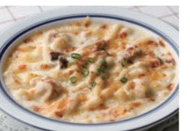
チキンと木の子のマカロニグラタン/ドリア 1,940円