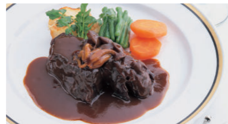
ビーフシチュー (ライス または パン付) 3,890円