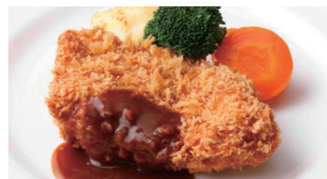
宮崎産南の島豚カツカツ(ロース) 2,160円