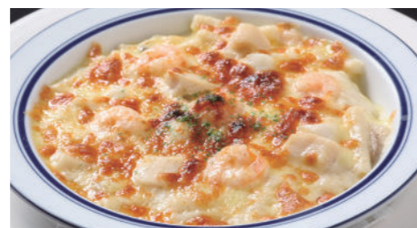
海の幸のマカロニグラタン/ドリア 1,940円