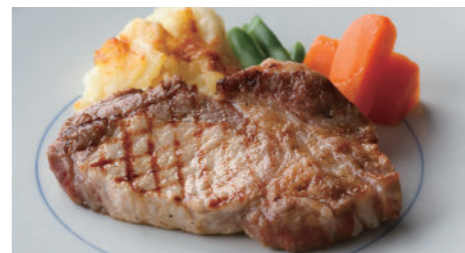
宮崎産南の島豚ロース(ソテー) 2,260円 (デミグラス または ジンジャーソース)