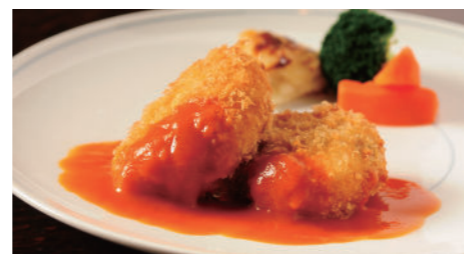
蟹クリームコロッケ (ライス または パン付) 1,940円