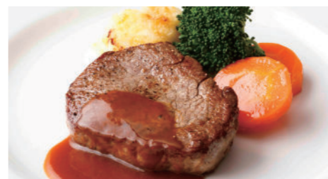
牛フィレステーキ(和風 または デミグラス) 3,910円